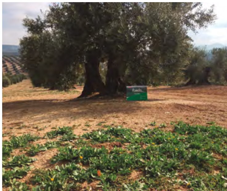
Eficacia de Ruedo ® 4 meses después de la aplicación.