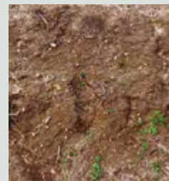
Malas hierbas en dos hojas